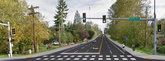
Rendering of Brook Blvd Intersection